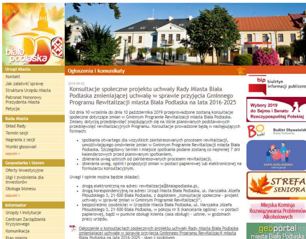
Rycina 5. Podgląd ogłoszenia o rozpoczęciu konsultacji społecznych na stronie Urzędu Miasta Biała Podlaska

4) na stronie Urzędu Miasta Biała Podlaska: http://www.um.bialapodlaska.pl/?msi=3747