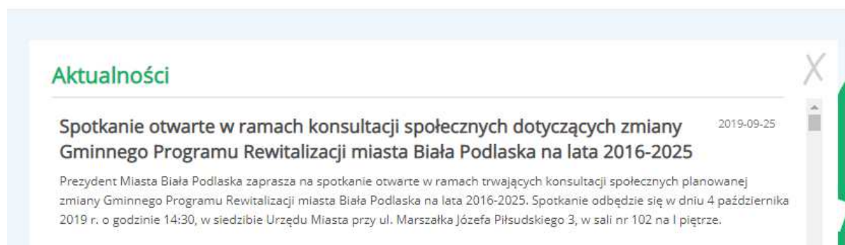
Rycina 6. . Informacja o terminie spotkania w ramach konsultacji społecznych dotyczących zmiany Gminnego Programu Rewitalizacji miasta Biała Podlaska na lata 2016-2025

Szybki kontakt: e-mail: rewitalizacja@bialapodlaska.pl tel. 83 341 61 05